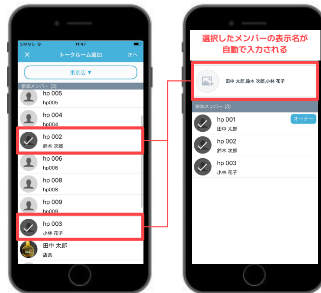
トークルームの作成