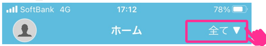
アプリ_ホーム画面

店舗選択画面で最上部「全て ▼」を選択することで、管轄店舗全ての店舗メンバー／連絡ノート／星を贈るを確認できます。